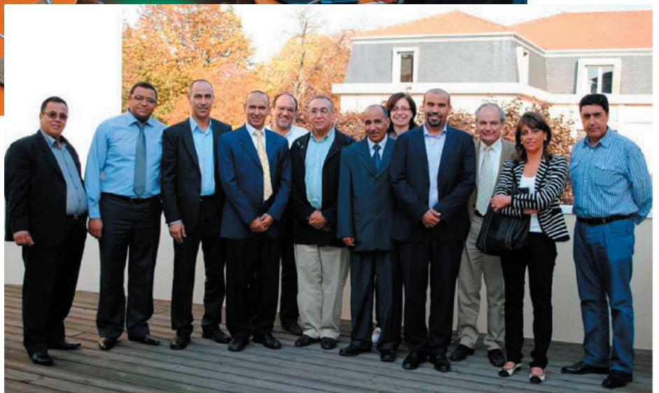
Ouverture du séminaire WP5 au PRES Lorrain à Nancy