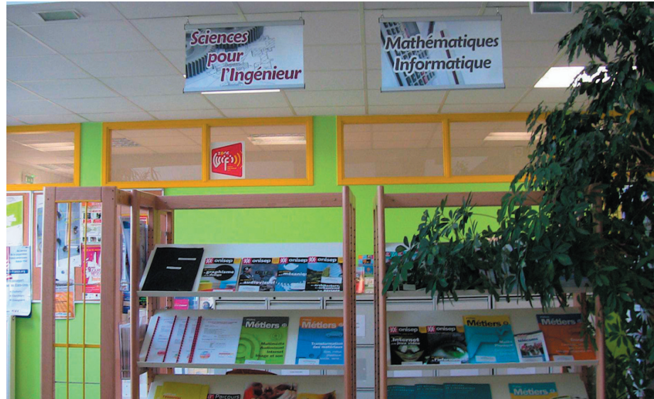
Cellule d'information et d'orientation : un service commun de l'UHP pour la

Moyens de la communication (presse, tv, radio, plaquettes, etc....)